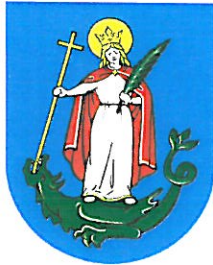
Urząd Miasta Nowego Sącza