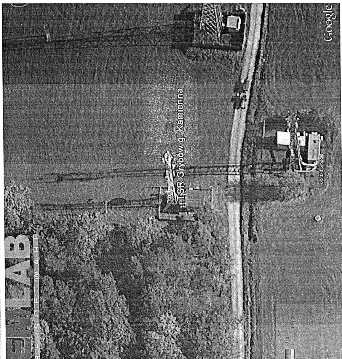
Rys. 2. Rzut poziomy rozkładu pola elektromagnetycznego anteny nowo projektowanej linii radiowej w otoczeniu TSR Grybów / g. Kamienna przewidzianej do zainstalowania na wysokości 31 m nad poziomem terenu.