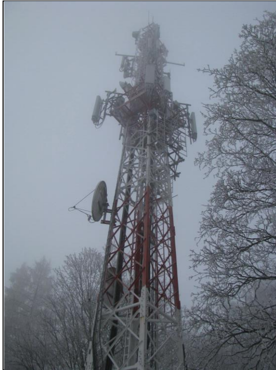
Zaf. nr 1: Widok ogólny instalacji radiokomunikacyjnej.