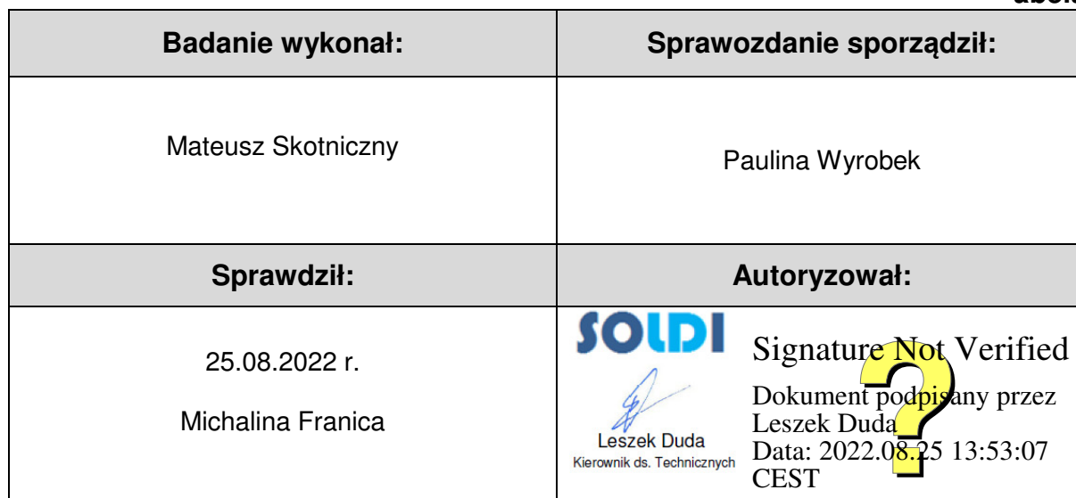
Tabela nr 6

Stwierdzenia zgodności dokonano na podstawie zasady podejmowania decyzji i wymagań zawartych w załączniku do Rozporządzenia Ministra Klimatu z dnia 17 lutego 2020 r. w sprawie sposobów sprawdzania dotrzymania dopuszczalnych poziomów pól elektromagnetycznych w środowisku [Dz. U. 2020, poz. 258, Dz. U. 2022, poz. 1121].