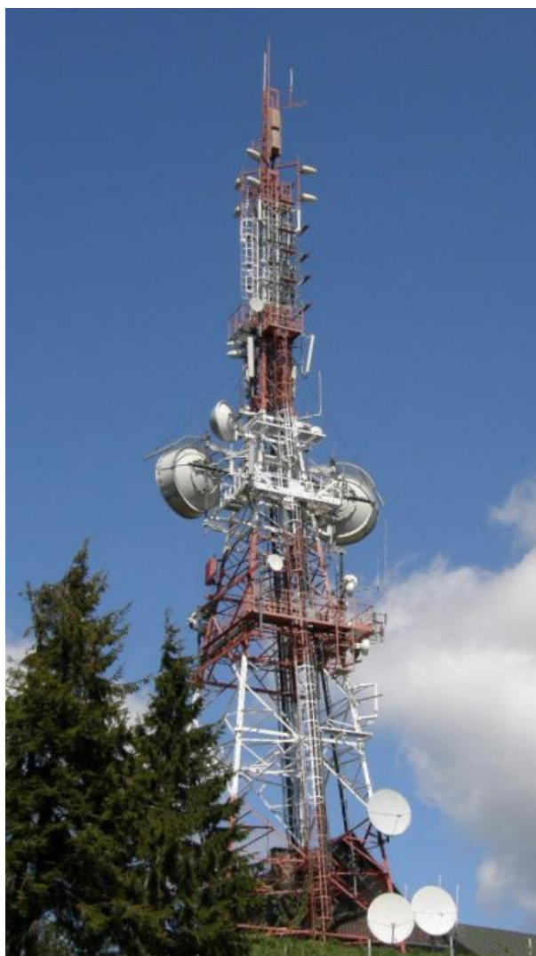
Fot. 1. TSR Krynica / g. Jaworzyna – widok obiektu