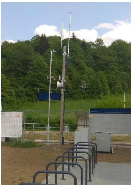
Widok obiektu wraz z zainstalowanym zespołem antenowym