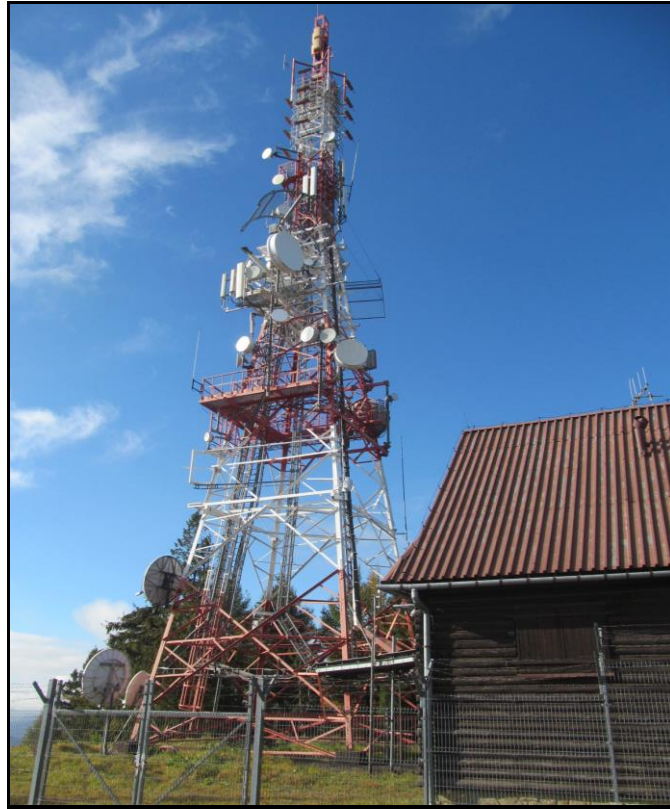
Zaf. nr 1: Widok ogólny instalacji radiokomunikacyjnej.