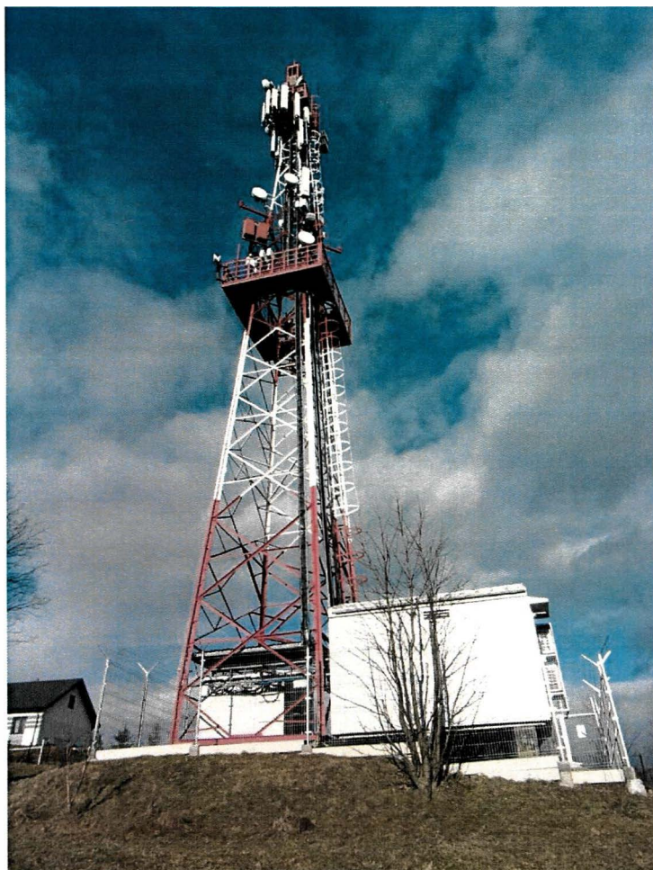
Zał. nr 1: Widok ogólny instalacji radiokomunikacyjnej.