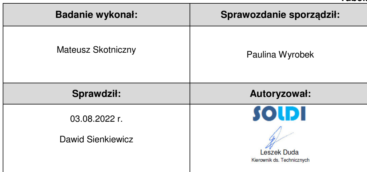
Tabela nr 6

Stwierdzenia zgodności dokonano na podstawie zasady podejmowania decyzji i wymagań zawartych w załączniku do Rozporządzenia Ministra Klimatu z dnia 17 lutego 2020 r. w sprawie sposobów sprawdzania dotrzymania dopuszczalnych poziomów pól elektromagnetycznych w środowisku [Dz. U. 2020, poz. 258, Dz. U. 2022, poz. 1121].