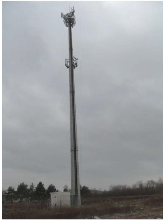
Zat. nr 1: Widok ogólny instalacji radiokomunikacyjnej.