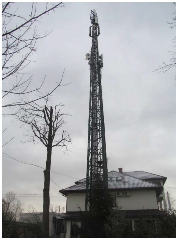
Załącznik nr 1: Widok ogólny instalacji radiokomunikacyjnej.

Koniec sprawozdania. Sprawozdanie zawiera dodatkowo załączniki nr 1 i 2.