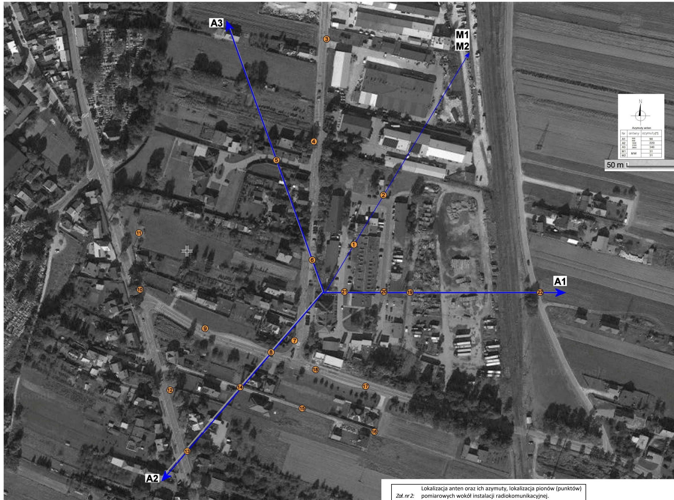
Zał. nr 2: Lokalizacja anten oraz ich azymuty, lokalizacja pionów (punktów) pomiarowych wokół instalacji radiokomunikacyjnej. Mapa źródłowa: Geoportal. -punkt (pion) pomiarowy.